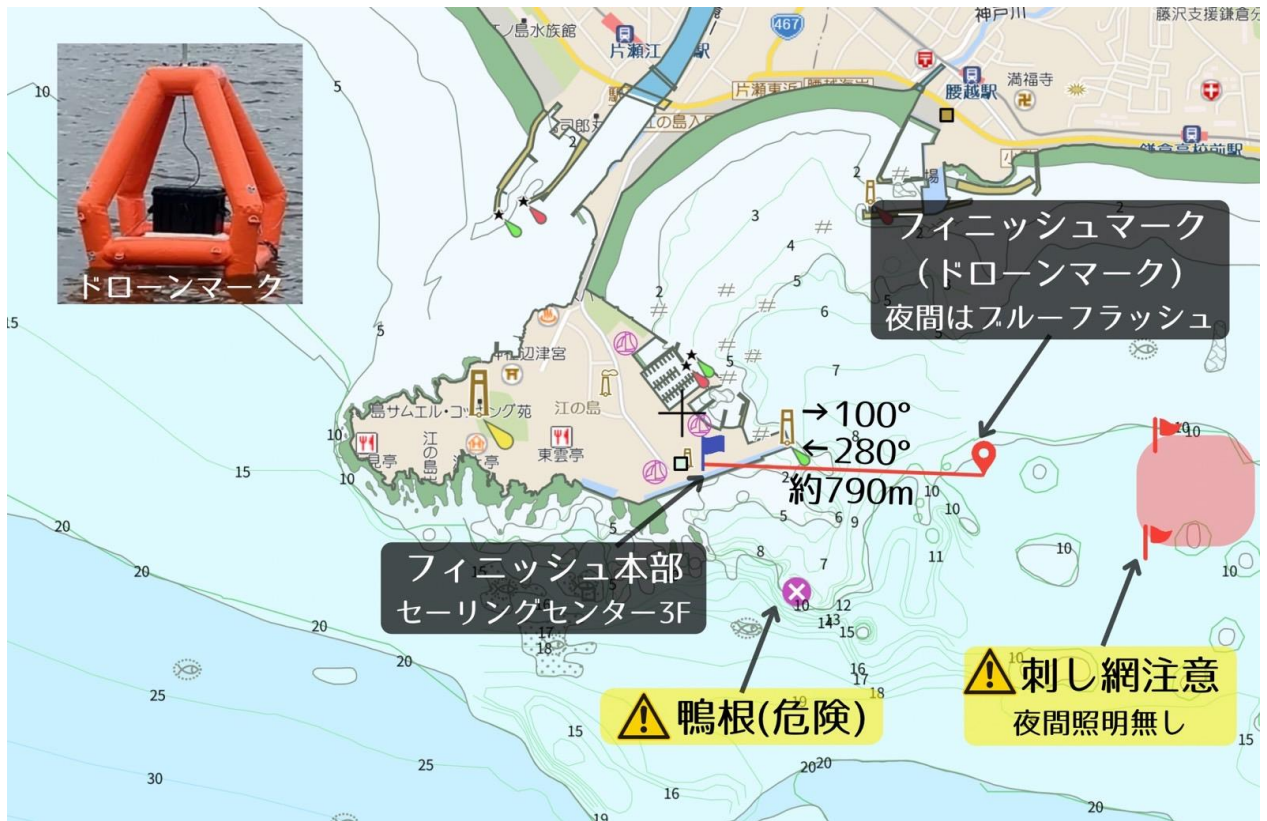
江の島セーリングセンター近辺俯瞰